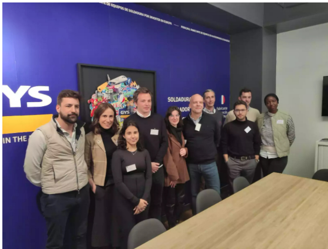
Miembros del equipo de GYS España y Francia

En lo que respecta al bricolaje , y en respuesta a una pregunta formulada por C de Comunicación durante la rueda de prensa, Bruno Bouygues ha explicado que el porcentaje de facturación de este sector representa el 10 % para la empresa, aunque ha admitido que hace 10 años ese porcentaje era del 40 %, y ha explicado que en Europa venden a 15 grandes grupos de bricolaje, entre ellos el Grupo Adeo, Kingfisher o Bauhaus.