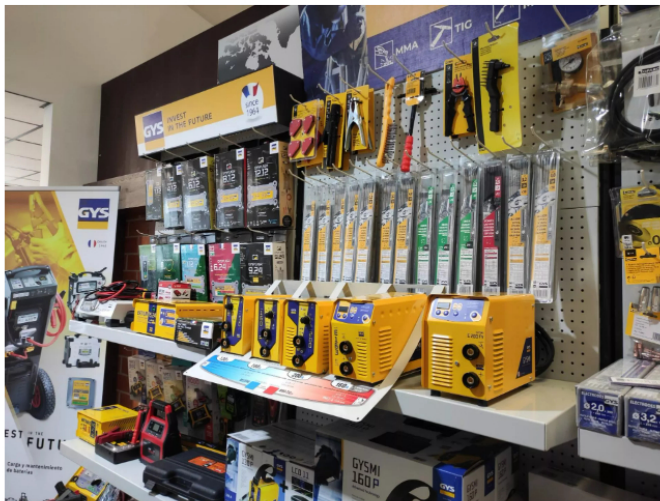
GYS es una empresa familiar francesa que cuenta, en la actualidad, con seis filiales

Durante la rueda de prensa se ha anunciado el lanzamiento de las tres nuevas gamas de máquinas MIG/MAG de GYS: la Kronos y Neomig-I, máquinas Inverter de alto rendimiento para soldadura industrial, y la E-Gys Auto, máquinas MIG/MAG Inverter para carrocería.